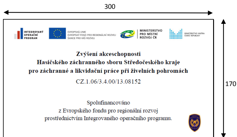
Obr. č. 2 – Vzor (všechny vzory viz tato příloha)

+ vzory dle jednotlivých krajů (objednatelů) (28 listů)