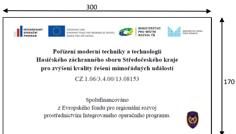
Obr. č. 2 – Vzor (všechny vzory viz tato příloha)

+ vzory dle jednotlivých krajů (28 listů)